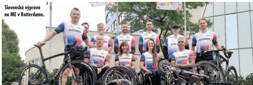
Slovenská výprava na ME v Rotterdame.